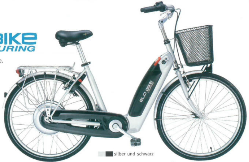
silber und schwarz

Elobike fahren und das Abstrampeln hat ein Ende. Der umweltfreundliche Elektromotor schaltet sich automatisch zu und entlastet Ihre Muskeln. Helmpflicht fällt hier ebenso weg wie Zulassung und Versicherung. Also garantierter Fahrspaß auf der ganzen Linie.